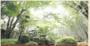
松花堂庭園・美術館 (しょうかどうていゐん・びじゅつかん)

天下五剣の一つ「童子切安綱(国宝)」を手がけた大原五郎太夫安綱と神が、山ノ井の水を用いた「髭切」「膝丸」を造った場所と伝わります。 ●朱印は、毎月1日・15日のみ ●春日神社にて授与