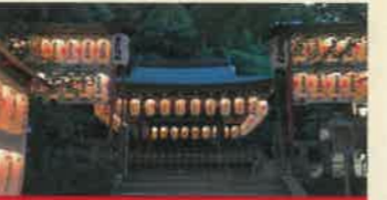
高良神社 (こうらじんじや)

男山の麓を流れる放生川に架かる橋で、八幡八景の一つ。大きく半円を描いた形は別名「たいこ橋」と呼ばれています。