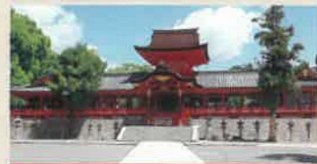
国宝 石清水八幡宮 (いwashimizuはちまんくう)

都の裏鬼門を守護し、伊勢神宮に次ぐ国家第二の宗廟と称された日本三大八幡宮のひとつ。国宝に指定された現社殿は、最古最大の八幡造。 ●夏季5:30~18:30 冬季6:30~18:00 ●境内自由 ●昇殿参拝1,000円