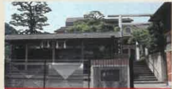
飛行神社 (ひこうじんじや)

室町時代に後奈良天皇の勅願寺となり、その後徳川家康公の側室・お龜の方の菩提寺として発展。本堂・大方丈・唐門など重要文化財も多数。 ●10:30~15:00 ●拝観料700円 ●拝観日限定のため要問合せ