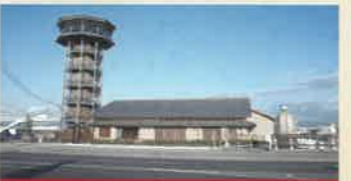
淀川三川合流域 さくらであい館 (せくわであいかん)

江戸時代初期に華やかな寛永文化の中心となって活躍した社僧・文化人の松花堂昭乗ゆかりの庭園。昭乗ゆかりの資料を展示する美術館も併設。 ●9:00~17:00 ※入園、入館は16:30まで ●庭園入園料100円、美術館観覧料400円 ●月曜休 ※祝日の場合は翌平日休