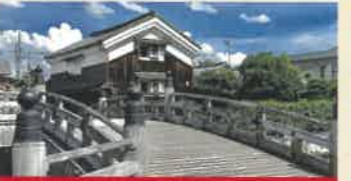
安居橋 (あんごばし)

木津川に架かる全長356.5mの日本最長級の木橋。増水時の抵抗を減らすため、床板が流れるよう設計されています。