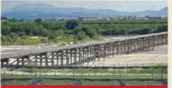
流れ橋(上津屋橋) (ながばし・こうづやばし)

宇治川と木津川を隔てる堤防。春には堤防沿い1.4kmに渡って桜並木が続く庄巻の花見スポットとしても知られています。