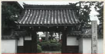
単伝庵 (たんでんあん)

世界で初めて飛行原理を発見した二宮忠八が空の安全と航空業界の発展を祈願して創建した神社。忠八ゆかりの資料を集めた資料館も併設。 ●9:00~16:30 ※資料館は16:00まで ●境内自由 ●資料館300円