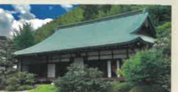
正法寺 (しょうほうじ)

石清水八幡宮の檢校(長官)を務めた善法律宮清が、邸宅を僧坊としたもので、足利義満の母の菩提寺。「もみじ寺」としても知られます。 ●8:00~17:00 ●境内自由 ●拝観料500円(要予約)