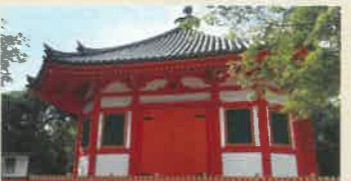
八角堂 (はっかくどう)

別名「らくがき寺」とも呼ばれる臨済宗妙心寺派の寺院。境内にある大黒堂の白壁に願いを書き入れる「らくがき祈願」で知られます。 ●土・日のみ拝観9:00~15:00 ※以外の日は要予約 ●拝観料100円 ●らくがき祈願料300円