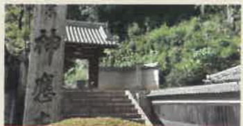
神應寺 (じんとうじ)

都の裏鬼門を守護し、伊勢神宮に次ぐ国家第二の宗廟と称された日本三大八幡宮のひとつ。国宝に指定された現社殿は、最古最大の八幡造。 ●夏季5:30~18:30 冬季6:30~18:00 ●境内自由 ●昇殿参拝1,000円