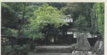
善法律寺 (ぜんぽうりつじ)

石清水八幡宮を開いた行教が創建。寺の紋は豊臣と徳川の家紋が二つ並ぶ珍しいもの。杉山谷不動尊とともに紅葉の名所としても知られます。 ●10:00~15:00 ●境内自由 ●拝観料500円(要予約)