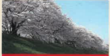
背割堤 (せわりてい)

流れ橋のそばにある交流施設。そばうちなどの体験(要予約)や宿泊ができるほか、地元野菜を使ったピュッフェのレストランも。 ●10:00~21:00 ※平日16:00~ 土日祝13:00~ ●月曜休 ※祝日の場合は翌平日休