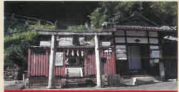
相槌神社 (あいづちじんじや)

江戸時代に幕府領の庄屋を務めた伊佐家の住居。今では入手困難な壁土「桃山」を用いた赤壁の主屋は、茅葺屋根の入母屋造り。 ●見学は10名以上より受付 ●申込は四季彩館