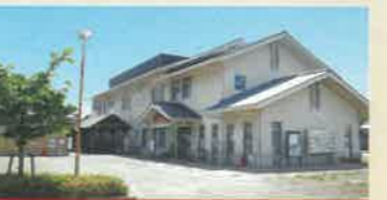
やわた流れ橋交流プラザ 四季彩館 (しきさいかん)

桂川・宇治川・木津川が合流する「三川合流地域」の観光周遊拠点。地上25mの展望塔からは背割堤の桜並木が一望できます。 ●9:00~17:00 ※展望塔利用受付は16:20まで ●12月29日~1月3日休